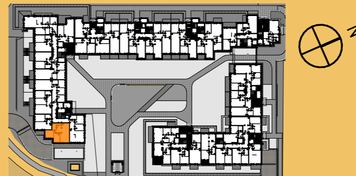
LOKALIZACJA MIESZKANIA W BUDYNKU